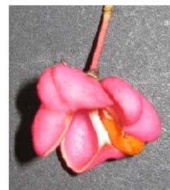
semeno v míšku